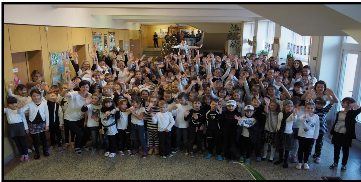
FOTO Z ČERNOBÍLÉHO DNE 2. 12. 2016