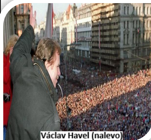
Václav Havel (nalevo)